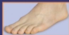
A Terbisil® krém a bőr bármely területén alkalmazható.

A kockázatokról és mellékhatásokról olvassa el a betegtájékoztatót vagy kérdezze meg kezelőorvosát, gyógyszerészét.